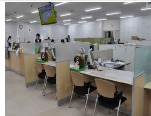
支所の金融・共済窓口の様子