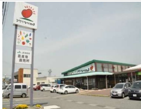
農産物直売所『アグリながぬま』