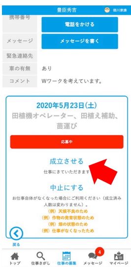
「成立させる」を押す