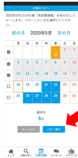
コピーで複数の日の募集